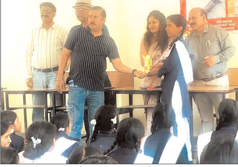
भीमताल तृतीय स्थान पर रहे।

सीनियर वर्ग विज्ञान क्रिज प्रतियोगिता में रा.इं.कॉ. बानना की टीम ने प्रथम स्थान प्राप्त किया, जबकि रा.इं.कॉ. भीमताल द्वितीय और रा.इं.कॉ. भूमियाधर तृतीय स्थान पर रहे। वहीं जूनियर वर्ग क्रिज प्रतियोगिता में रा.इं.का. नौकुचियाताल प्रथम, रा.इं.का. जंगलियागांव द्वितीय और रा.बा.इं.कॉ.